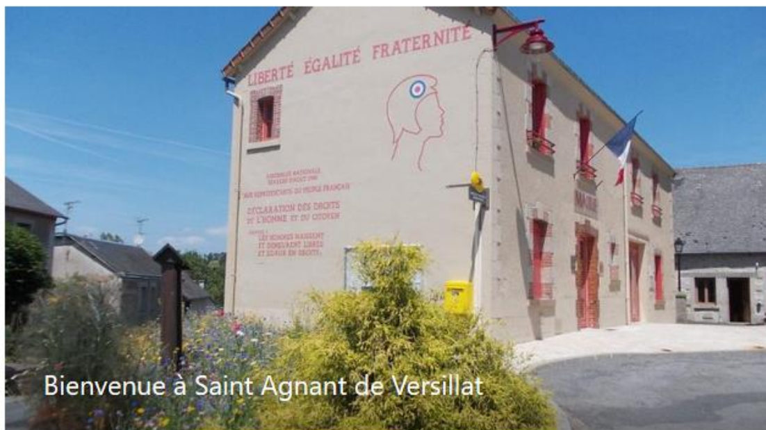
Bienvenue à Saint Agnant de Versillat