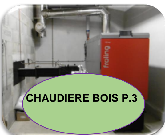
CHAUDIÈRE BOIS P.3