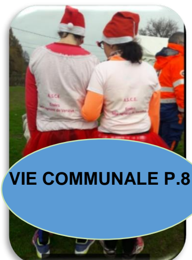
VIE COMMUNALE P.8