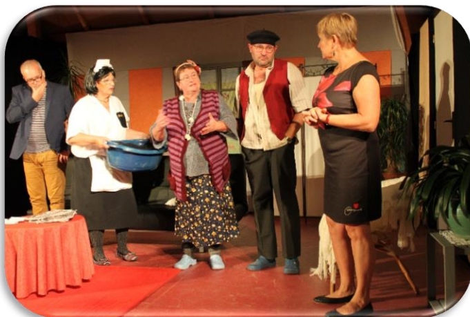
Représentation de la troupe « Versillat Loisirs en Coulisse »