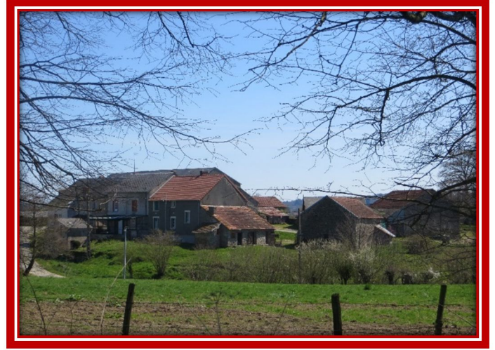
1. Essouby ; 2. Lotissement de la Sedelle ; 3. Le Cluzeau ; 4. Peufeurier ; 5. Villeberthe ; 6. Bouchardon