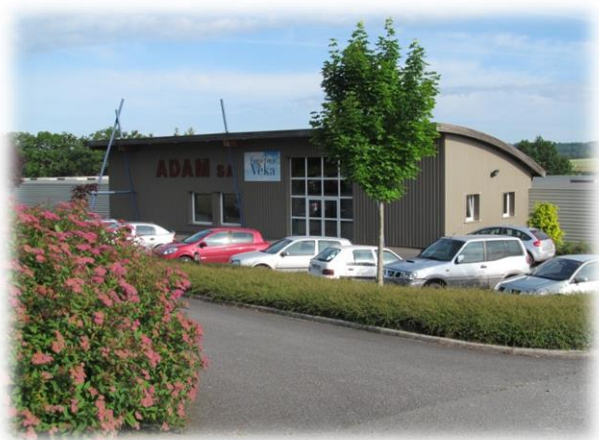
SAS ADAM, Menuiseries bois - PVC - alu