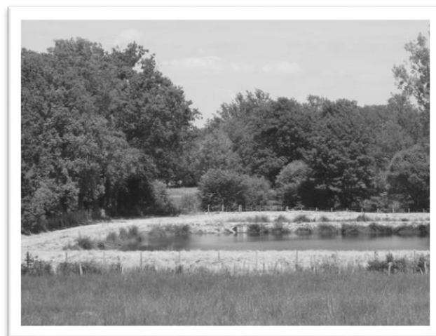
La lagune de traitement des eaux usées du Bourg

Le produit des redevances a représenté une recette de 18 473 €.