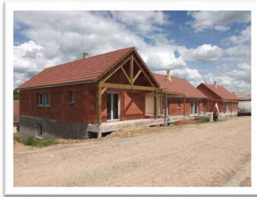
L'Office H.L.M. CREUSALIS termine la construction de quatre logements au lotissement La Sédelle : trois Type 4 et un type 3. Normalement, fin 2013, ils seront proposés à la location.