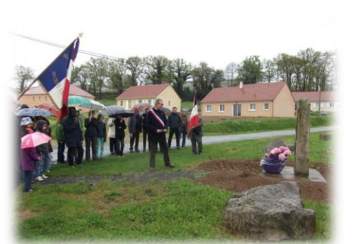
Comme lors de chaque cérémonie à la mémoire des Anciens Combattants et Victimes de guerres, les enfants du groupe scolaire et les citoyens de tous âges se sont retrouvés les 8 mai et 11 novembre dernier pour que le souvenir se perpétue.