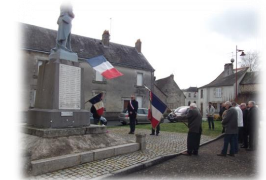
La loi du 6 décembre 2012 a institué le 19 mars, « journée nationale du souvenir et de recueillement à la mémoire des victimes civiles et militaires de la guerre d'Algérie et des combats en Tunisie et au Maroc ». Une revendication portée depuis des années par les associations d'Anciens Combattants, aujourd'hui reconnue...