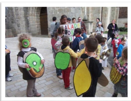
Pour le Carnaval, les enfants de l'école ont parcouru les rues du bourg en arborant fièrement les déguisements qu'ils s'étaient confectionnés, sur le thème des fruits et légumes ; une façon de prolonger l'opération « Un fruit à la Récré ».