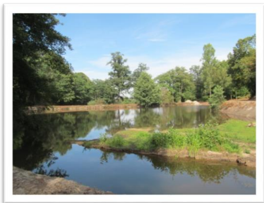
Les employés communaux ont réalisé des travaux d'aménagement autour de l'étang de Bellevue, acquis par la commune en 2009.